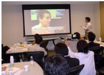
商品プレゼンテーション イメージ