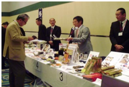
ブースでの商品PR イメージ

卸事業者による自社取り扱い商材のPR、農業生産法人による生産食材のPR (ブース試食も想定。希望者のみ各社5分程度でプレゼンテーション実施)